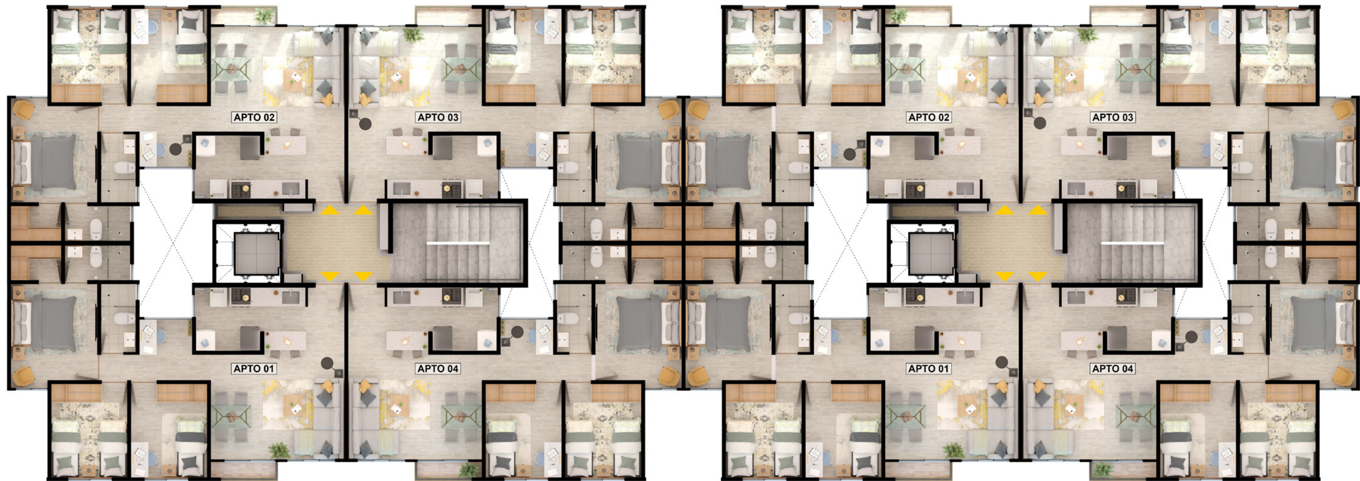
TORRE DE 4 APARTAMENTOS