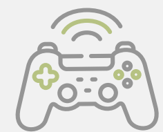
Salón de Juegos