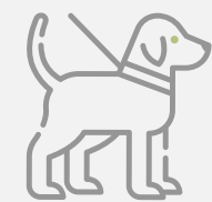
Zona de Mascotas