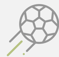
2 Canchas Sintéticas